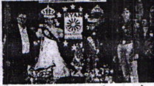
उदयपुर, 15 फरवरी। सुरजपोल अमल का कांटा स्थित रोयाटो एडुकेशनस

कार्यालय जिला परिवहन एवं पंजियन अधिकारी, उदयपुर क्रमांक : परिपंजी/2019-20/ दिनांक : 11.02.2020 प्रेस विज्ञापित