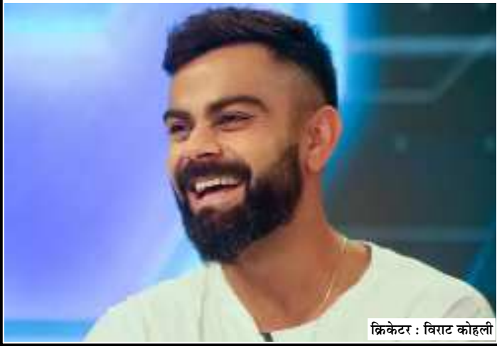
क्रिकेटर : विराट कोहली