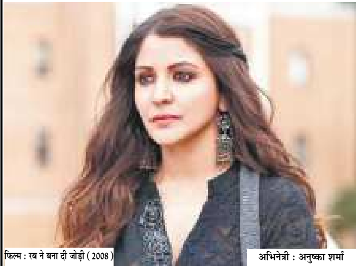
फिल्म : रब ने बना दी जोड़ी ( 2008 )